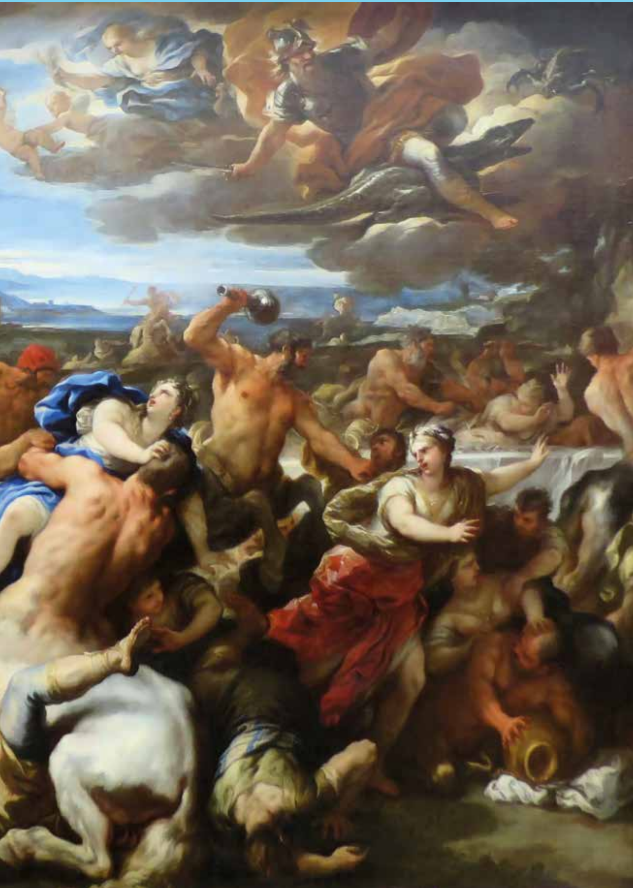
Luca Giordano, 1634 - 1705 Strijd tussen de Lapithen en Centauren